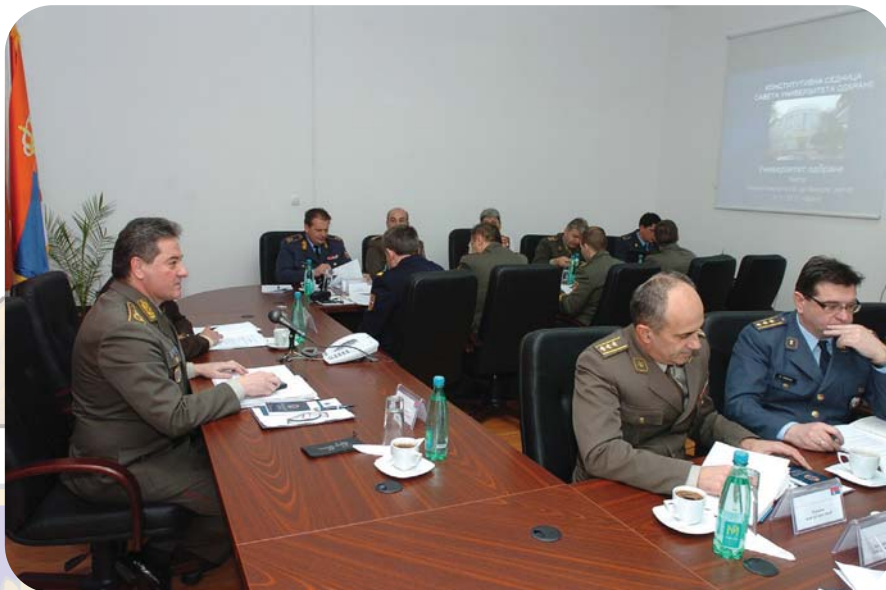
Конститутивна седница Савета Универзитета одбране

Чином акредитације тих установа и њихових студијских програма, створене су претпоставке да се у наредној фази