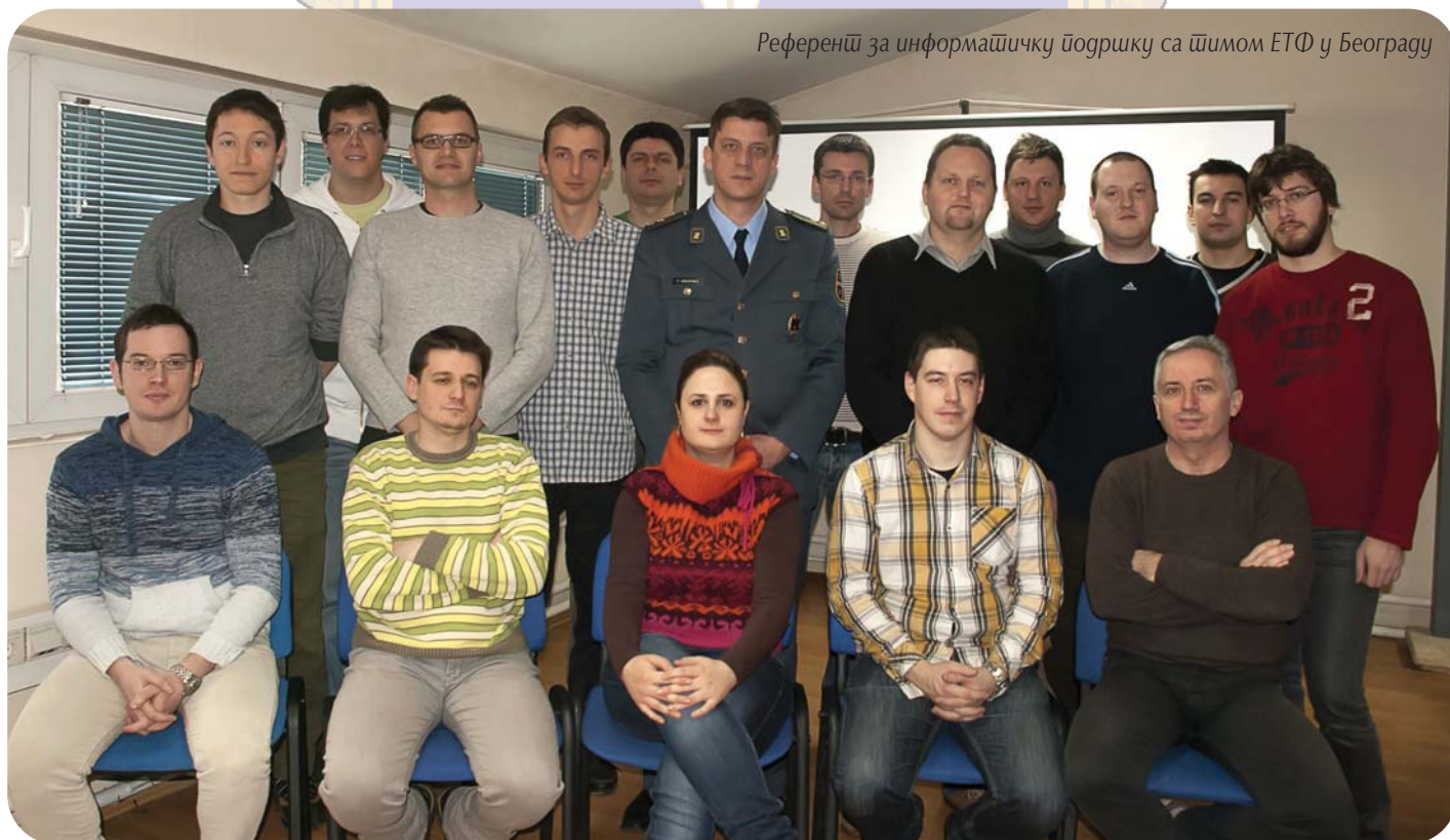
Референци за информатичку подршку са тимом ЕТФ у Београду

Универзитет одбране, као део образовног и научног система Републике Србије, опредељен је да настави реализацију образовног процеса и научноистраживачке делатности у областима од интереса за одбрану и осталим областима од значаја за достизање потребних способности припад-