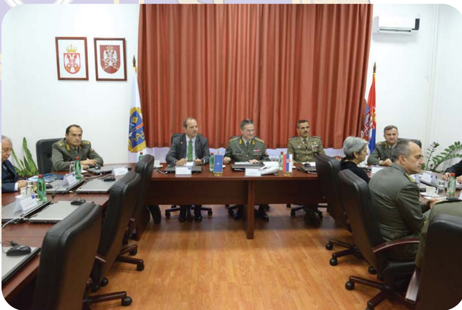
Посећа шима НАТО-а Универзитету одбране

У прошлој години издато је 16 уџбеничких наслова, а још шест је спремно за предају у 2014. години. Интензивно се ради на анализи постојећих и потребних уџбеника за све