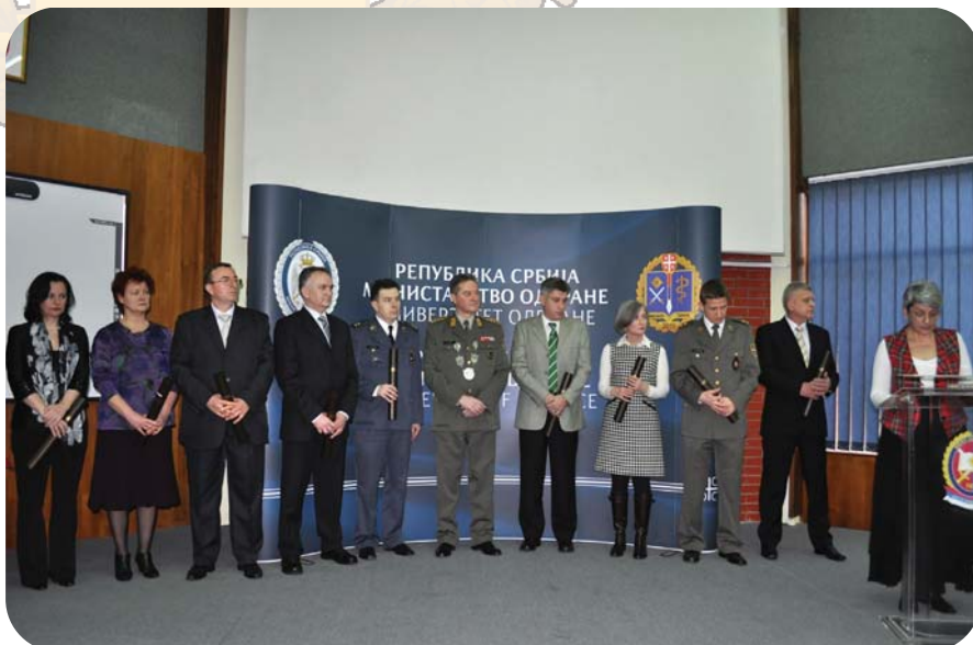
Додела докторских диплома у Универзитету одбране

Војна академија и Медицински факултет ВМА Универзитета анализирали су у претходном периоду стање у тој области, на основу чега је 2012. године сачињен и први План научноистраживачке делатности на Универзитету одбране. Научноистраживачки пројекти планирају се на период од најмање три године, а Сенат Универзитета одобрава