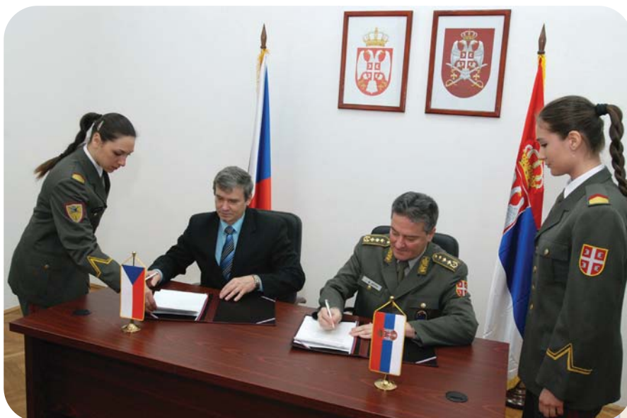
Потписивање сјоразума о сарадњи с Универзитетом одбране Чешке

Од конститутивне седнице (9. децембар 2011) до краја јануара 2014. године одржане су 23 седнице Сената. Једна од најзначајнијих његових активности јесте избор у звања наставника. У протеклом периоду изабрано је 39 наставника Војне академије и 27 наставника Медицинског факултета ВМА.