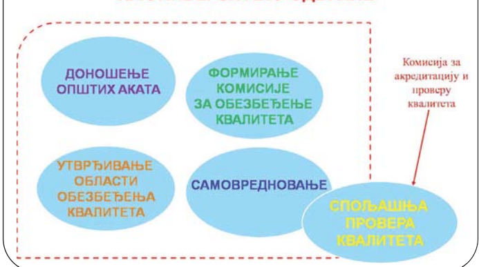
Мере за обезбеђење квалитета