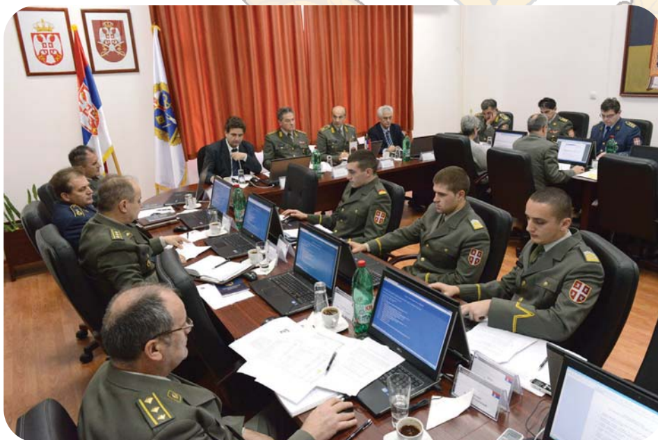
Седница Савета Универзитета одбране

Универзитет одбране интегрише функције високошколских јединица у свом саставу тако што интегрише њихову образовну и научноистраживачку делатност, обезбеђује њихово јединство и усклађено деловање, утврђује заједничку политику и заједничке развојне планове високошколских јединица у свом саставу, обезбеђује мобилност кадета, студената и наставника Универзитета, контролу и унапређење квалитета и конкурентност наставног, научног и стручног рада, осигурава ра-